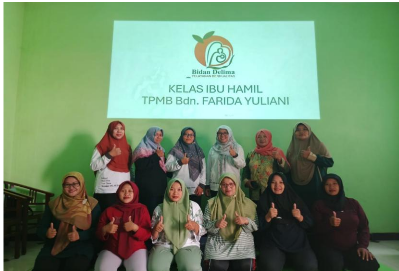
Gambar 4. Peserta kelas Senam Hamil, 2025