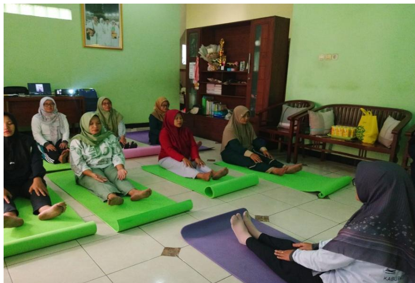
Gambar 3. Praktik Bersama Senam Hamil, 2025