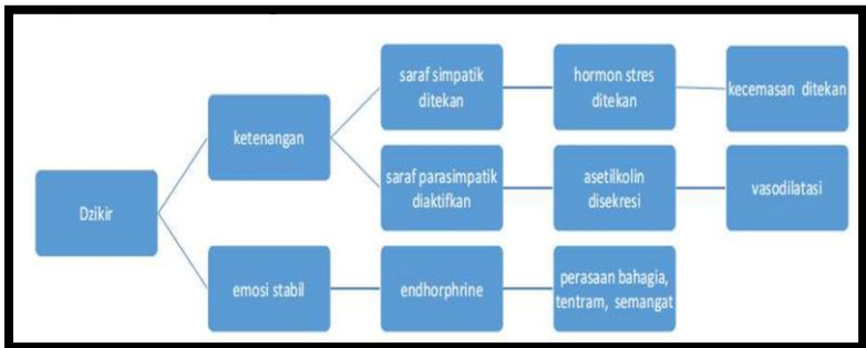
Gambar 2 Mekanisme dzikir dalam menurunkan kecemasan masa hamil.

meningkatkan fungsi kerja limbik, yang menghasilkan endorfin, yang terkait dengan munculnya perasaan bahagia dan semangat. Berikut ini adalah beberapa contoh praktik dzikir yang dapat membantu mengurangi kecemasan selama kehamilan: